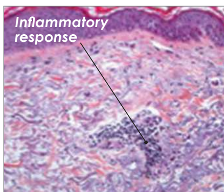
24 horas después de la sesión

Como reacción, la dermis crea más colágeno y elastina. 1