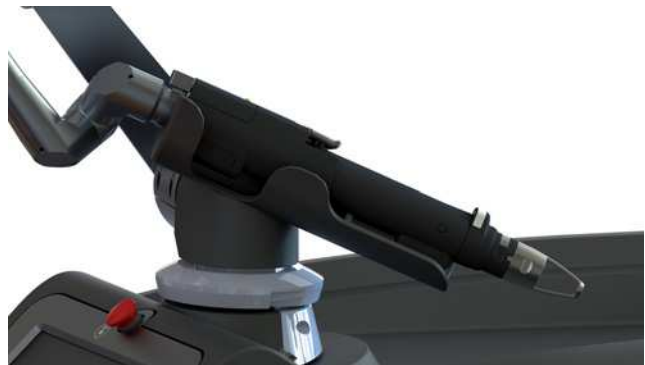
Systema de emisión de 532 nm

Láser en estado sólido integrado en la plataforma PicoSure con soporte universal para facilitar el acceso al tratamiento.